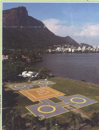
Lagoa - Parque dos Patins / Lagoon Tel. / phone: (+55 21) 2259-6995